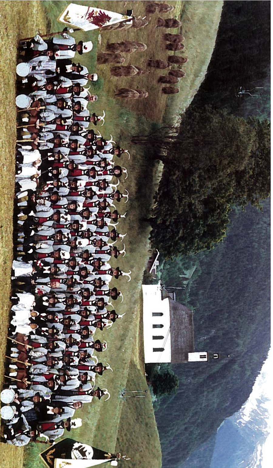
Schützenkompanie Mamsau im Gimental